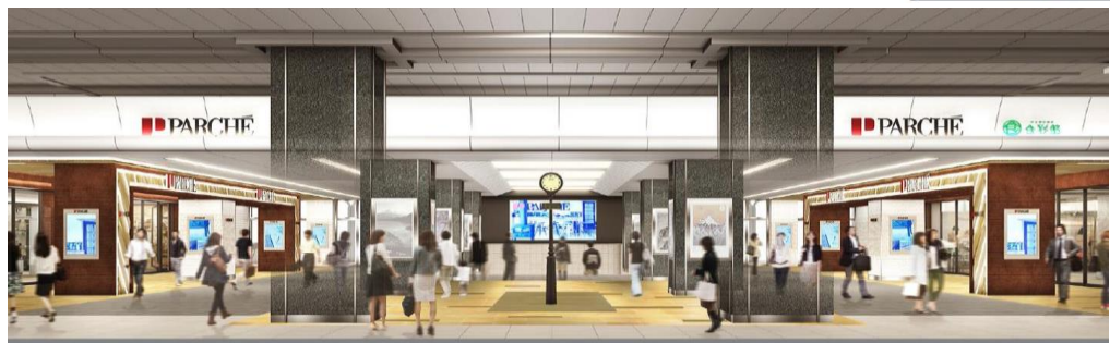
「パルシェスクエア」(イメージ)