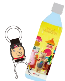
ペットボトル&ペットボトルホルダー (イメージ)